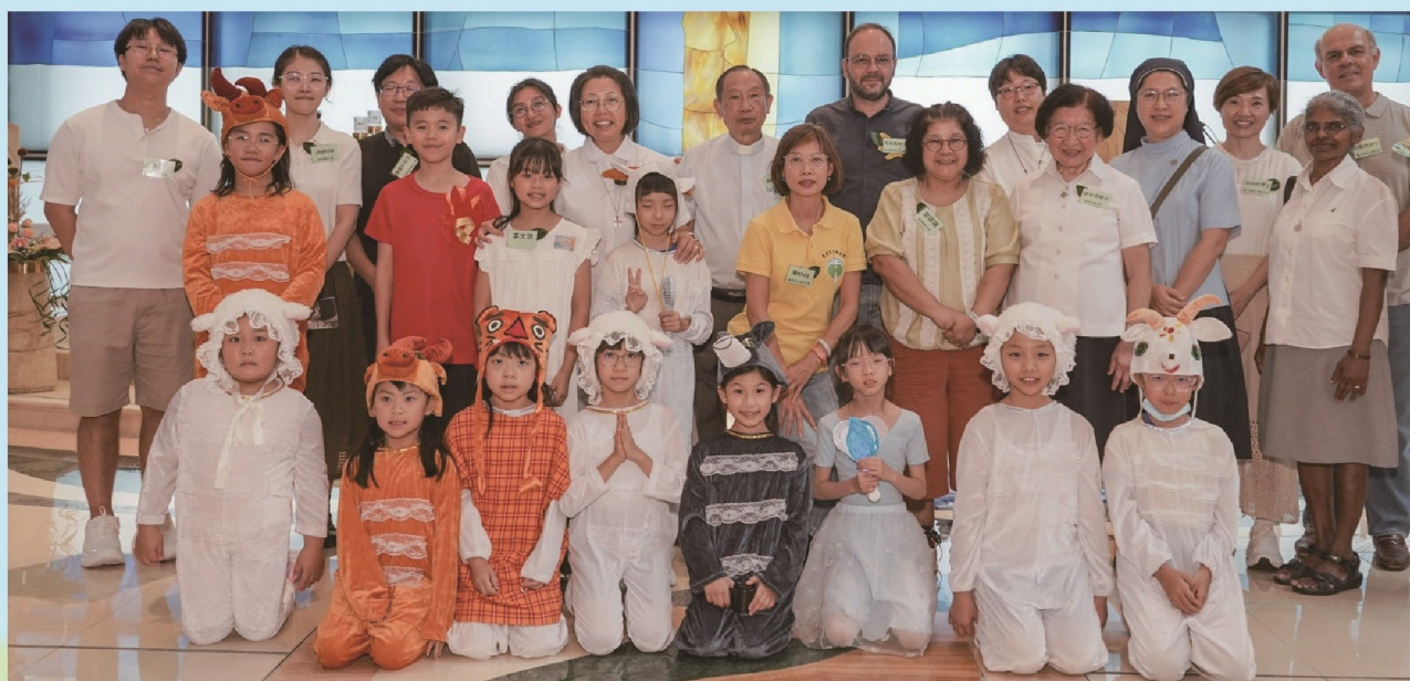
精彩的開幕禮結束後一起合照